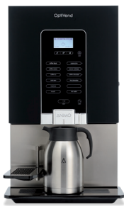
OptiVend 32 TS NG

Der OptiVend ist eines der marktführenden Geräte für die kontinuierliche Lieferung von Instant-Kaffee und Schokolade, mit hoher Geschwindigkeit und maximaler Ausnutzung der Tassenqualität.